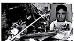
স্বজনদের সঙ্গে মিলিত হয়ে অভিযুক্তের বাড়িতে আশ্রয় দিল গ্রামবাসী।